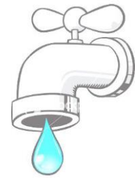
在流动的饮用水下（70° F 或更低）

问题： 肉类、家禽、海鲜等在室温下解冻。这种做法非常危险。食物表面可迅速升温至危险温度区（41° F 至 135° F），并会在几个小时后产生足以引起食源性疾病的细菌或毒素。