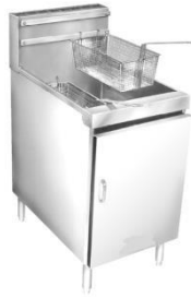
作为烹饪的一部分（冷冻到炸锅）